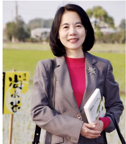
周麗芳 教授 教育部彈性薪資專案辦公室主持人 國立政治大學財政學系教授 國立政治大學綠色能源財經研究中心主任

在全球化競爭、資訊化崛起之際，人才移動已跨越國界，人才延攬與留任不再是封閉性的本土議題，更當放眼全球，從國際競爭角度儲備人才戰略優勢。人才移動並非零合遊戲，理想的人才移動將促進循環式人力資源發展，經由人才與周遭生活環境、文化社會的融合，將帶來非制式路徑的觀念轉變與社會進步，進而引爆前瞻思潮、帶動科學突破、激發團隊合作，並加速國家智慧資本累積。綜整而言，人才是國家最重要的公共資產，也是社會創新與經濟成長的核心動能，各國無不積極培育在地人才，採取國際獵才行動。